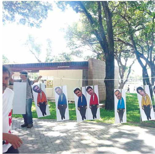
11 bonecos de deputados federais paraibanos foram pendurados em árvores no Parque Sólton de Lucena