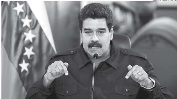
Uma decisão da Corte, o presidente Nicolás Maduro é o principal beneficiado, já que trava uma verdadeira batalha contra as políticas de oposição

Mas o governo de Trump ainda não decidiu se cumprirá os compromissos do Acordo de Paris, e vários de seus integrantes, entre eles os secretários de Defesa, James Mattis, e Estado, Rex Tillerson, deram indícios de que são a favor de que os Estados Unidos continuem a apoiar o pacto climático.