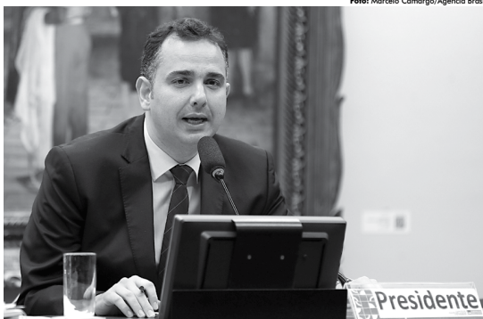
Presidente da CCJ, deputado Rodrigo Pacheco, disse que as dez medidas de combate à corrupção são de iniciativa popular.

O projeto que trata das medidas de combate à corrupção foi aprovado pela Câmara em novembro do ano passado e encaminhado ao Senado. No entanto, em dezembro, o ministro do Supremo Tribunal Federal (STF) Luiz Fux suspendeu a tramitação da matéria, anulando todas as fases percorridas pelo projeto, inclusive as diversas alterações promovidas pelos deputados até a votação final na Câmara,