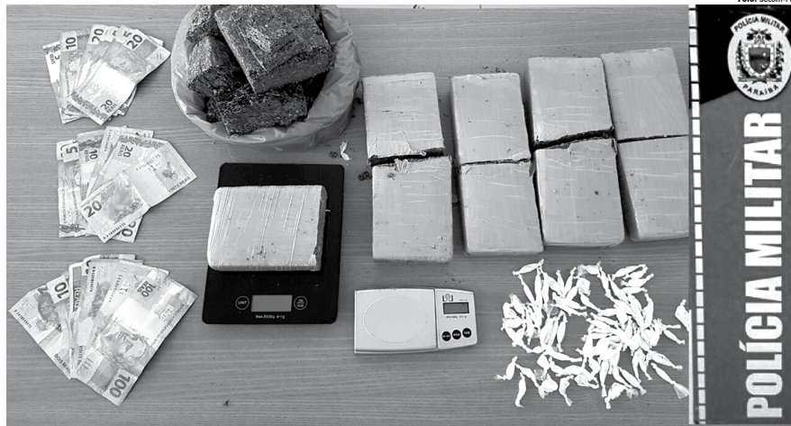
No local, no bairro de São José, em João Pessoa, foram encontrados três pacotes de maconha, prontos para o consumo, além de uma pequena quantia em dinheiro