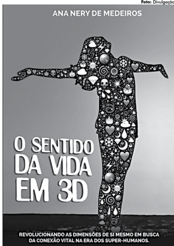
Capa da obra, que estimula o leitor na superação de desafios

O Sentido da Vida em 3D - cujo subtítulo é Revolucionando as dimensões de si mesmo em busca da conexão vital na era dos super-humanos - contém reflexões, casos clínicos e questionamentos na tráfice corporeamente-espírita, apontando os caminhos para a obtenção da coragem, fé e ousadia para o enfrentamento dos desafios e a superação dos medos, bem como arrancar as máscaras que aprisionam a essência do