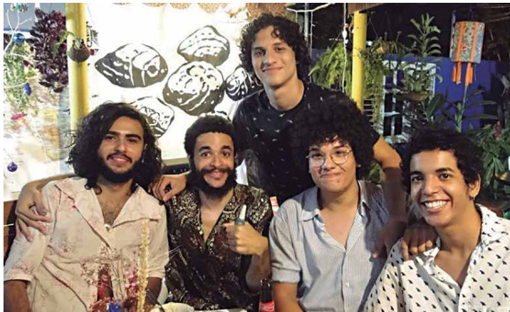
Banda Flor de Pedra no cenário musical de João Pessoa neste ano de 2017 e, apesar do pouco tempo na estrada, o primeiro EP está em gravação

A banda Flor de Pedra, recente no cenário artístico local, iniciou sua trajetória em João Pessoa neste ano. A referência base do estilo da banda é tipicamente nordestino-brasileira, onde passa também pelo soul abraçado, forró de raiz, maracatu, até às músicas criadas nos ritmos de matizes africanas, outra influência forte da banda, que passeia pelo batuque dos terreiros e pela guitarra do blues. Mesmo com pouco tempo de formação, o primeiro EP da Flor de Pedra está