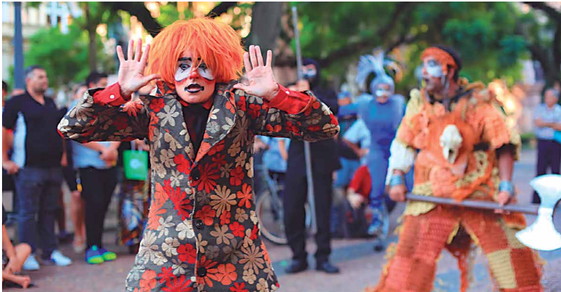
O espetáculo intitulado Caliban - A Tempestade , de Augusto Boal, é a mais nova criação cênica para teatro de rua da Tropa de Atadores "O Nôis Aqui Traveiz" e será encenado nesta tarde, por volta das 16h, na Praça da Bandeira