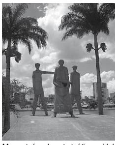
Monumento em um dos pontos turísticos da cidade