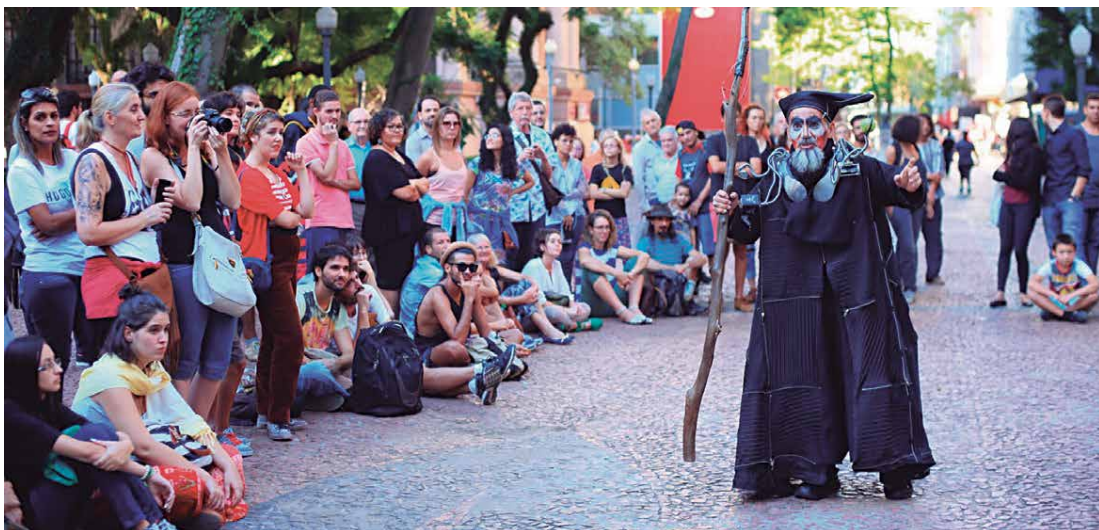
Montagem inédita com a qual o grupo ganhou homenagem pelo Serviço Social do Comércio abre a programação para o público campinense e releitura de Augusto Boal da obra homônima do inglês William Shakespeare

Além dos espetáculos principais, a edição número 20 do Palco Giratório contará com seminários, nos quais serão discutidos aspectos relevantes das artes cênicas e políticas públicas para o teatro, entre outros temas. Também serão realizadas oficinas com o objetivo de promover e incentivar as manifestações artísticas regionais, fomentando a troca de experiências. O Sesc promove ainda o "Pensamento Giratório", um espaço aberto ao público para reflexão e discussão sobre o trabalho e pesquisa dos grupos itinerantes.